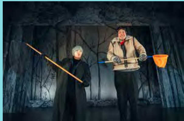
Simsalabim – hils på Brødrene Grimm!

Når forestillingen begynner møter vi de to brødrene som er ute for å samle historier som flyr mellom trærne i Svartskog. Denne gangen finner de eventyret om Hans og Grete. De har med seg Fabulatoren, en oppfinnelse som forvandler historier til eventyrbøker. Men oi, nå ramler de inn i fabulatoren selv!