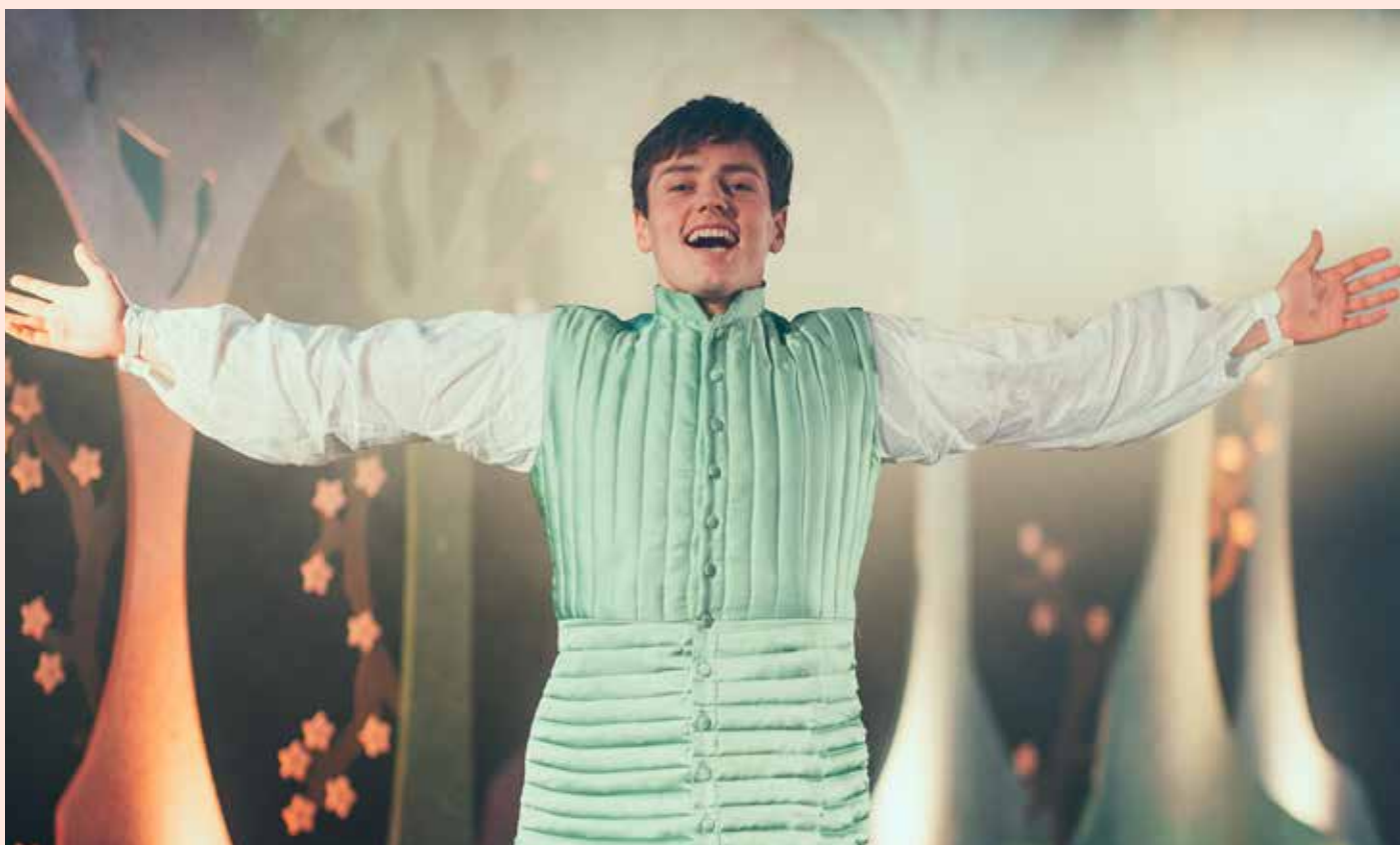
Bilde fra Brageteatrets forestilling «Brødrene Løvehjerte» i 2023.

Vi gleder oss til å møte deg og gi deg en hyggelig opplevelse!