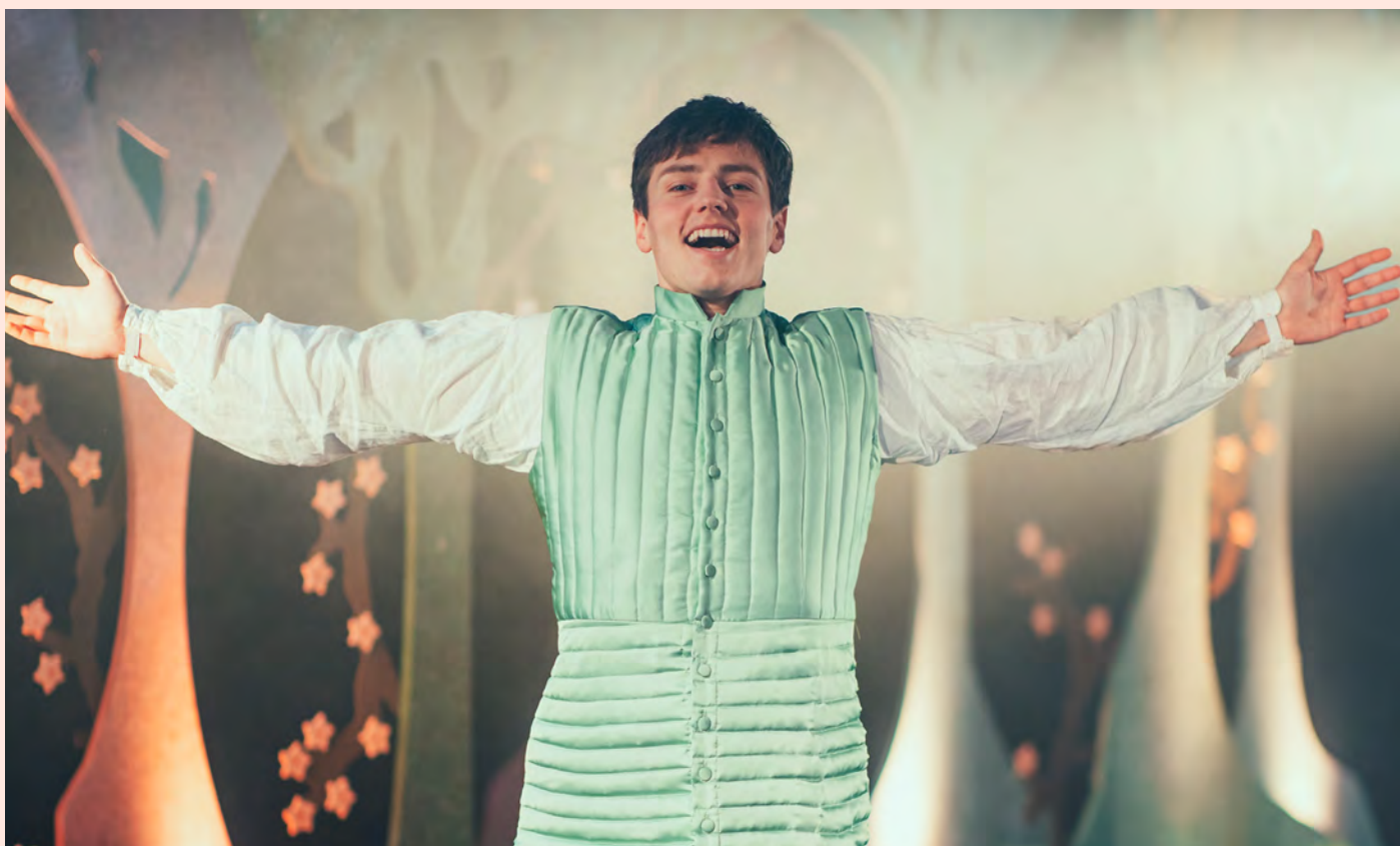
Bilde fra Brageteatrets forestilling «Brødrene Løvehjerte» i 2023. Fotograf: Kevin Dahlman, Scream media

Vi gleder oss til å møte deg og gi deg en hyggelig opplevelse!